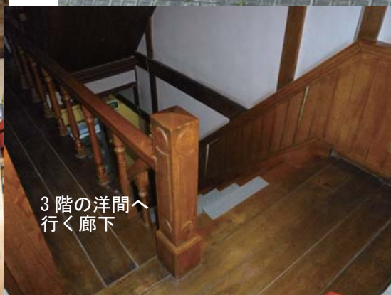
3階の洋間へ行く廊下