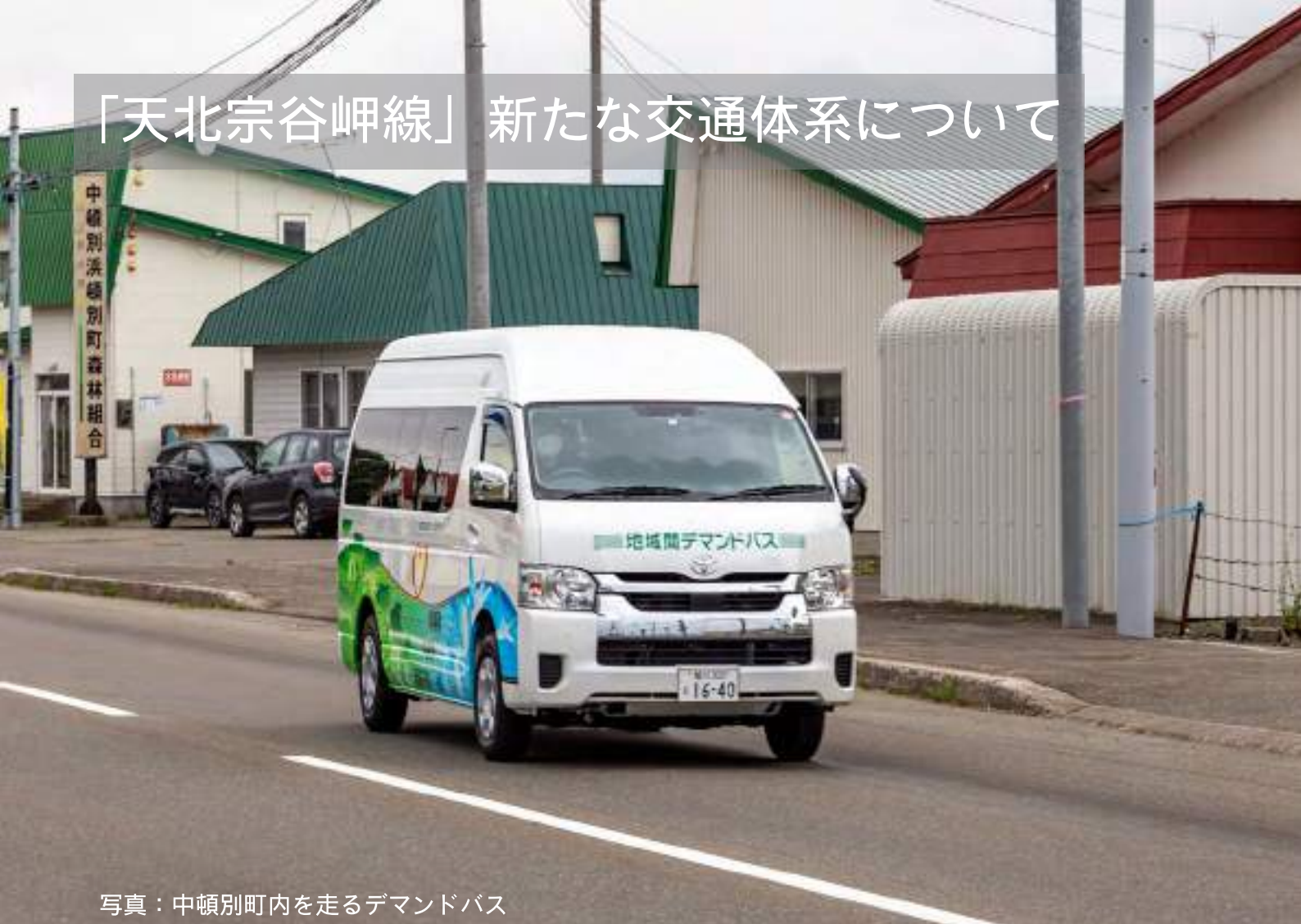
写真：中頓別町内を走るデマンドバス

中頓別町を含む沿線地域の交通を支えている路線バスである「天北宗谷岬線（浜頓別町から音威子府村区間）」が、令和5年度10月から新たな交通体系に移行されることとなり、これに伴って、8月よりデマンドバスの実証運行が開始されます。今月号では、デマンドバスの実証運行について、ご紹介していきます。