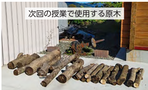
次回の授業で使用する原木

特許を所得したのは、中頓別町からもすごいことができるということを示したかったからであると話されており、今後の展望としては、そうや自然学校や体験型観光で、「リバーシブル木琴チャイム」づくりが体験できるようになれば、また、町内の木材として、ナラやタモ、アカエゾマツが手に入れば、もっと完成度の高い楽器ができると話されていました。