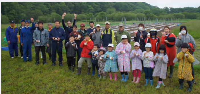
← 昨年の定植体験会の様子