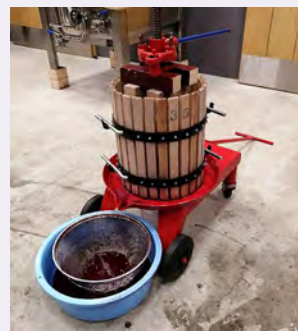
← ワイン試験醸造の様子