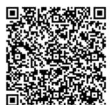
「下水道使用休止届」

水道・下水道の使用をやめるときは、使用水量を調べて料金を精算しますので、使用休止の1週間程度前を目安に手続きをお願いします。